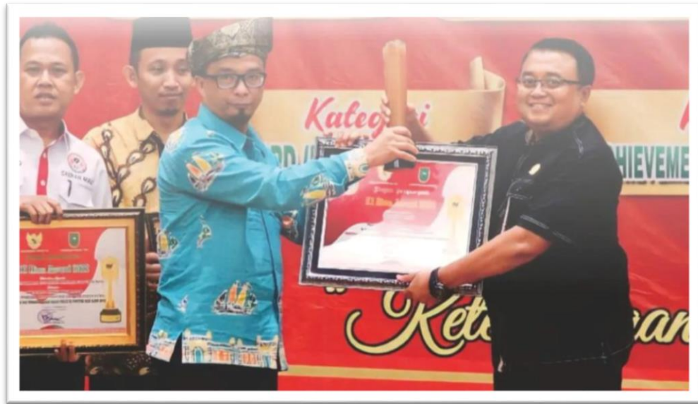
Gambar 1.2 Penganugerahan Keterbukaan Informasi Publik Tahun 2022 Kategori Bawaslu Kabupaten/Kota Se-Provinsi Riau

kemampuan untuk memulai sesuatu yang baru menjadi hambatan dalam pencapaian program PPID masih menjadi salah satu kendala. Namun, dibalik keterbatasan anggaran tersebut, PPID Bawaslu Kabupaten Siak berupaya memberikan kinerja terbaik dalam pelayanan informasi kepada masyarakat. Pada Tahun 2022, Bawaslu Kabupaten Siak dianugerahi penghargaan dari Komisi Informasi Provinsi Riau sebagai Lembaga Menuju Informatif Kategori Bawaslu Kabupaten/Kota Se-Provinsi Riau.