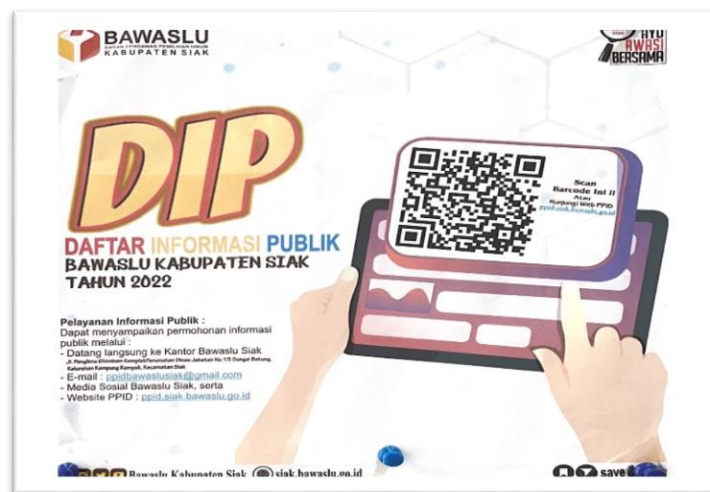
Gambar 5.2 Tampilan Barcode DIP Bawaslu Kabupaten Siak

Dari segi pelayanan informasi, saat ini Bawaslu Kabupaten Siak hanya melalui desk layanan informasi dengan datang langsung ke Kantor Bawaslu Kabupaten Siak maupun via email. Belum adanya akses permohonan melalui website PPID Bawaslu Kabupaten Siak. Hal ini disebabkan karena website resmi PPID yang belum digunakan secara optimal dan masih dalam tahap pengembangan. Harapannya kedepan sistem E-PPID yang sudah diterapkan di Bawaslu RI dan Bawaslu Provinsi, secepatnya juga sudah dapat diterapkan di Bawaslu Kabupaten Siak, sehingga mempermudah bagi masyarakat dan PPID Bawaslu Kabupaten Siak sendiri dalam pelaksanaan pengelolaan informasi publik yang baik dan cepat. Seiring dengan kemajuan teknologi, Bawaslu Kabupaten Siak telah melakukan inovasi terkait akses Daftar Informasi Publik dengan menggunakan sistem barcode . Masyarakat dapat langsung untuk mengakses Daftar Informasi Publik Bawaslu Kabupaten Siak hanya dengan melakukan scanning pada Barcode yang telah tersedia, sehingga dapat memberikan kemudahan dalam pelayanan informasi kepada publik.