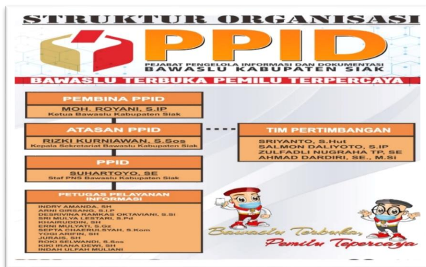
Gambar 1.1 Struktur Organisasi Tim Keterbukaan Informasi Publik PPID Bawaslu Kabupaten Siak

Sejak mulai terbit dan diberlakukannya peraturan Bawaslu nomor 10 tahun 2019 tentang Pengelolaan dan Pelayanan Informasi Publik Badan Pengawas Pemilihan Umum, Badan pengawas Pemilihan Umum Provinsi, Badan pengawas Pemilihan Umum Kabupaten/Kota, dan surat edaran Bawaslu RI Nomor: 0075/K.BAWASLU/HM.00/III/2020 tentang Pelayanan Informasi pada Bawaslu Provinsi dan Bawaslu Kabupaten/Kota, maka Bawaslu Kabupaten Siak telah membentuk Tim Keterbukaan Informasi Publik (TIM KIP) dan menetapkan Pejabat Pengelola Informasi dan Dokumentasi Bawaslu Kabupaten Siak sebagaimana tertuang dalam Keputusan Ketua Badan Pengawas Pemilihan Umum Kabupaten Siak Nomor 047/HK.01.01/K.RA-09/10/2022 terhitung tanggal 03 Oktober 2022.