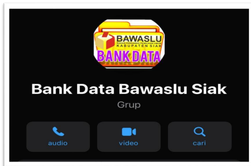
Gambar 5.1 Tampilan grup Bank Data Bawaslu Kabupaten Siak

Grup bank data tersebut diisi oleh Koordinator divisi data dan informasi sebagai pengampu dalam pengelolaan PPID, PPID, dan Tim KIP. Seluruh dokumen yang telah dikirim, akan dihimpun oleh staf bagian data dan informasi untuk dilakukan inventarisasi dan pengelompokan jenis dokumen yang kemudian data tersebut disajikan dalam bentuk Daftar Informasi Publik (DIP). Sehingga memudahkan PPID Bawaslu Kabupaten Siak jika sewaktu-waktu dokumen tersebut dibutuhkan.