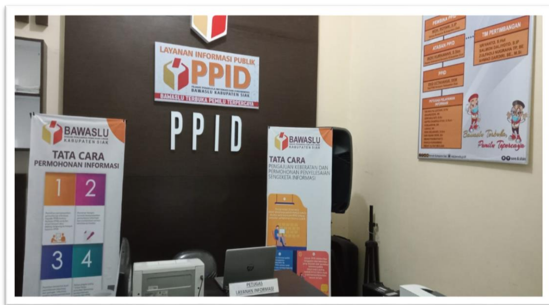
Gambar 2.1 Ruang Pelayanan Permohonan Informasi PPID Bawaslu Kabupaten Siak

Oleh sebab itu, hingga saat ini untuk pelayanan permohonan informasi publik, masyarakat dapat mengajukan permohonan layanan informasi dengan cara datang langsung ke Meja Layanan Informasi Publik di Kantor Bawaslu Kabupaten Siak yang beralamat di Jl. Panglima Ghimbam kompleks rumah dinas jabatan no. 15 Sei. Betung Kel.Kp. Rempak Kec. Siak kab. Siak. Selain itu, informasi juga tersedia melalui website utama Bawaslu Kabupaten Siak dengan domain siak.bawaslu.go.id , akun media sosial instagram @bawaslusiak, fanpage facebook Bawaslu Kabupaten Siak, dan twiter @BawasluSiak.